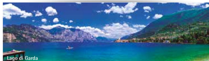
Lago di Garda